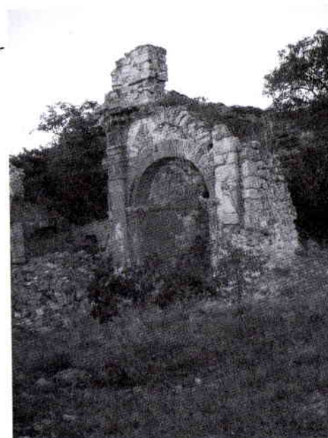
Capilla lateral. Iglesia del convento de San Guillén. Castielfabib.

altar una cofradía fundada bajo dicha advocación desde las postrimerías del siglo XVI.